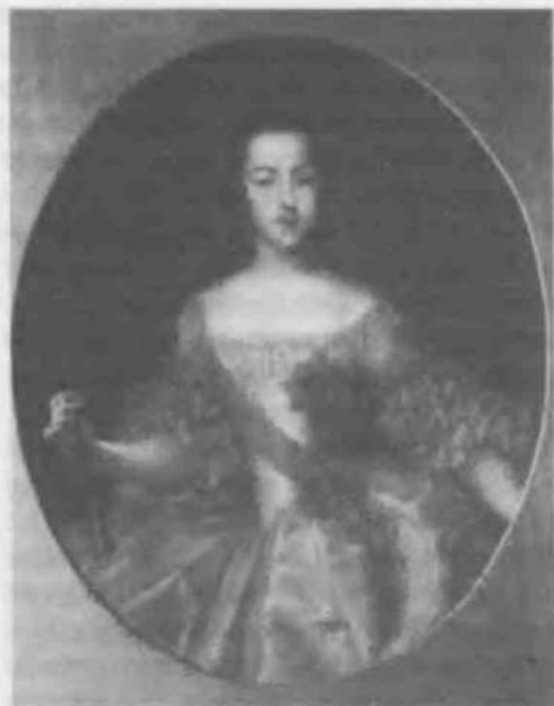
13. Великая княгиня Екатерина Алексеевна. Сер. 1740-х гг. Портрет Г. Гроота.

Она родилась 21 апреля 1729 года в Штеттине в семье принца Христиана Августа Ангальт-Цербстского и его супруги княгини Иоганны Елизаветы. При рождении девочка была наречена Софией Августой Фредерикой, а имя «Екатерина» получила в России в 1744 году при крещении в православие. Характер Екатерины, ее стремления, духовные запросы и потребности с самого начала были иными, чем у ее мужа. Она была умна, хитра, честолюбива, прекрасно понимала, что в лице Петра ей улыбнулось счастье, и готова была бороться за него всеми доступными способами. За 18 лет, прошедшие с ее приезда в Россию до восшествия на престол, она постаралась получше узнать страну, ее историю, традиции и обычаи. Впоследствии она сама признавалась, что использовала любой шанс, чтобы завоевать симпатии будущих подданных: была демонстративно набожна, не скупилась на подарки, не останавливалась перед откровенной лестью и в результате весьма преуспела в достижении своей цели.