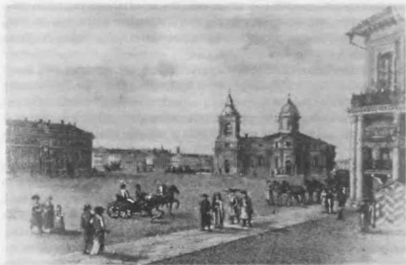
17. Вид Исаакиевской площади в Санкт-Петербурге при Екатерине II

дированы монополии в некоторых отраслях, а крупные заводы, в последние годы елизаветинского царствования попавшие в результате щедрости Медного банка в частные руки, вновь перешли к государству. Это была ошибка, ибо достаточных средств для развития тяжелой промышленности у государства не было, и результатом этой меры было еще большее отставание России от ведущих европейских стран. Вместе с тем упростился порядок организации новых предприятий, их регистрации и т.д. В 1775 году были введены льготы для купцов 1-й, 2-й и 3-й гильдий, а одновременно увеличен имущественный ценз для записи в них, т. е. право на запись в купеческую гильдию получали лишь наиболее богатые, те, кто был в состоянии «объявить» определенный капитал. По мысли законодательницы, это должно было стимулировать предпринимателей к более активной деятельности. В том же году было введено право открывать промышленные предприятия без какого-либо специального разрешения правительственных органов. В 1780 году специальным указом была закреплена частная собственность на владение фабриками и заводами. Все эти меры в целом благотворно сказались на развитии промышленности, в особенности легкой — шелкоткацкой, суконной, кожаной, галантерейной и др. Несколько иначе обстояло дело