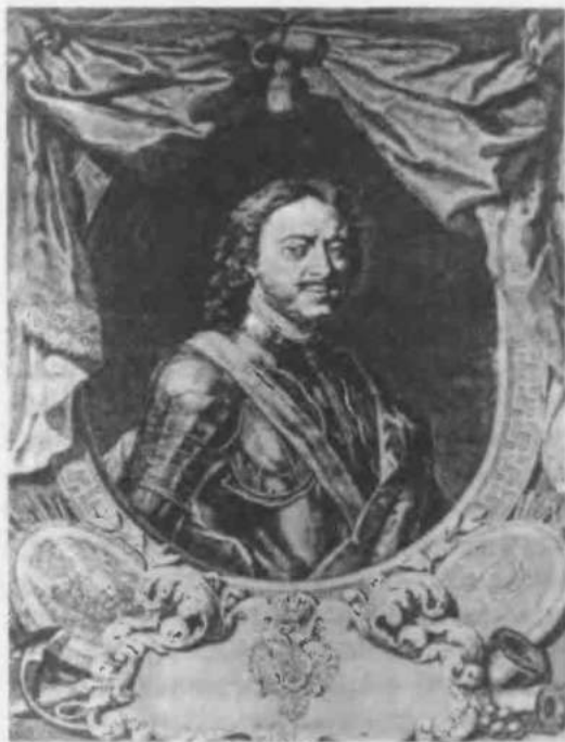
5. Петр Великий

Важные детали оснастки этого корабля были добавлены именно в 1720—1722 годах. Сперва был издан уже упоминавшийся Генеральный регламент — основа бюрократической системы, затем, в январе 1721 года, появился регламент Главного магистрата. Это было начало новой реформы городского управления. Главный магистрат — по сути, еще одна коллегия — был подчинен непосредственно Сенату, а его президент назначался царем. В свою очередь Главному магистрату подчинялись избираемые горожанами городские магистраты. Сами города делились на пять отделов в зависимости от количества в них дворов, а их жители — на две гильдии. К первой было отнесено состоятельное купечество, городские доктора, аптекари, ювелиры, иконописцы и художники, ко второй мелкие торговцы, ремесленники, наемные работники. При этом регламент Главного магистрата предписывал объединяться по профессиям в цеха, наподобие западноевропейских. Все эти новшества вводились параллельно с переписью городского населения с целью подушного обложения, и в резуль-