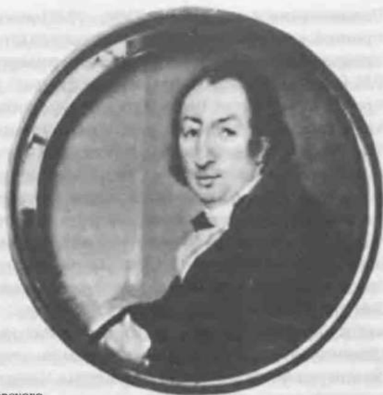
18. Н. И. Новиков.