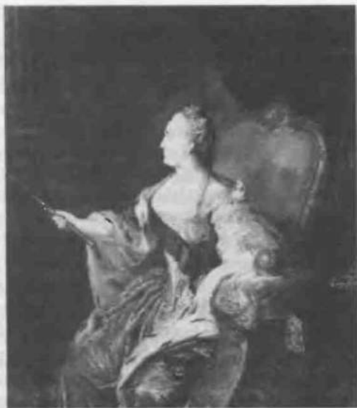
14. Императрица Екатерина Великая

руживала недостатки Петра Великого. Его законы... восходили в основном к устаревшему и жестокому Уложению 1649, и ему не удалось сделать их более современными и гуманными. Фактически он стремился сделать акцент на наказании и править скорее при помощи страха, чем любви и согласия с подданными. Хотя просвещенная немецкая принцесса одобряла направление реформ реформатора России, его желание заменить старый мир новым, сам он, с ее точки зрения... слишком уж принадлежал к этому старому миру» 14 . Свои собственные «правила управления» Екатерина II сформулировала следующим образом: