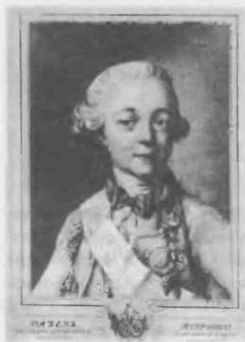
20. Великий князь Павел Петрович в 1765 г.

Зная, как должно быть, он сравнивал усвоенную теорию с реальностью, находил несоответствия и постепенно начинал критически относиться к политике матери. Между тем Екатерина не только не собиралась уступить сыну престол, но даже поделиться с ним властью. При этом она знала, что и при дворе, да и в целом в стране было немало людей, которые предпочли бы сына матери. Быть может, если бы тщеславие Павла не подогревалось различными интриганями, постоянно напоминавшими ему о его правах на престол, отношения матери с сыном сложились иначе. Но на протяжении нескольких десятилетий имя великого князя постоянно всплывало в различных политических процессах, по стране распространялись слухи о его восшествии на престол, к нему, как к «сыну», взывал Пугачев. Все это заставляло Екатерину относиться к Павлу с настороженностью и подозрительностью, и она делала все, чтобы не допускать его к политике. В свою очередь в Павле росло раздражение и неудовлетворенность. Годами он, неглупый и энергичный человек, мучился бездеятельностью, вынужден был издали наблюдать за делом, которое по праву считал своим. Уже тот факт, что в руках фаворитов императрицы оказывалось больше власти, чем у него, законного наследника престола, воспринимался им как обида и унижение. К этому добавлялись насмешки и язвительность матери, считавшей юного Павла слишком наивным и чувствительным и тем самым ожесточавшей его. Постепенно характер Павла изменился: он стал нервным, вспыльчивым, подозрительным, желчным, деспотичным.