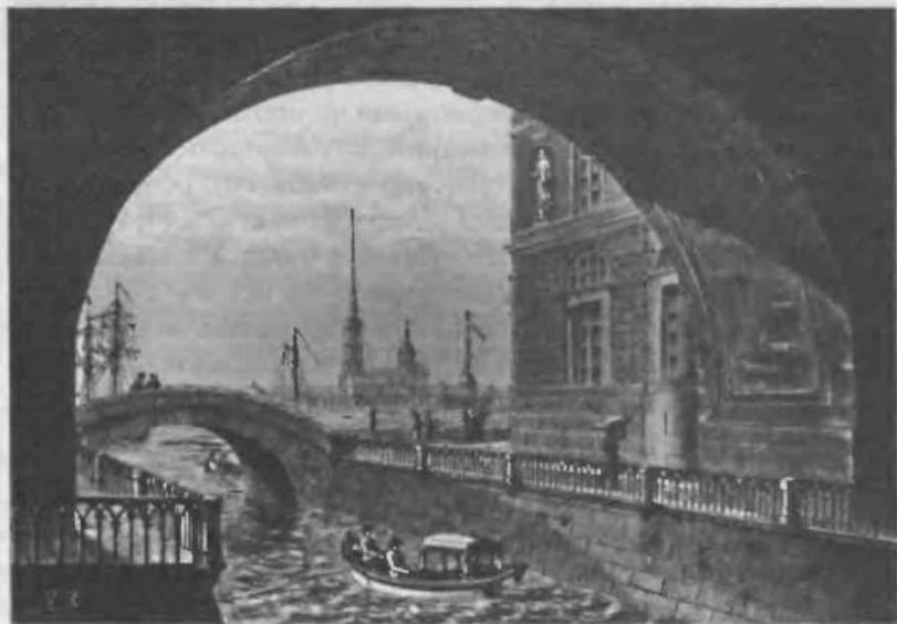
21. Вид Петропавловской крепости в Санкт-Петербурге во второй половине XVIII в.

Обратим внимание и еще на одно обстоятельство. Возникшее в петровское время и подкрепленное в екатерининское представ-