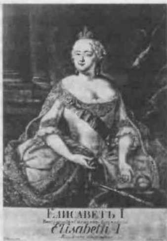
10. Императрица Елизавета Петровна

была чарующе красива. Это обстоятельство в огромной мере определило ее характер, наклонности, привычки и пристрастия, ибо во всех своих проявлениях она была прежде всего женщиной. С ранней юности Елизавета полюбила веселье и всевозможные развлечения: балы, маскарады, пирушки, охоту, театр. Юная цесаревна блистала на придворных празднествах, ловила восхищенные взгляды иностранных дипломатов и слыла непревзойденной в искусстве танцев. Она обожала наряды и драгоценности и нередко вызывала раздражение Анны Иоанновны, появляясь при дворе в нарядах, более роскошных, чем у императрицы. Когда