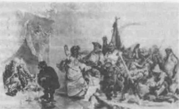
8. Свадьба в Ледяном доме. С картины Якоби

Михайловича, чтоб по слогу и по наречию старому куриозны и любопытны и не велики б были» 21 . Иными словами, в истории Анну интересовала только «куриозность», т.е. забавность, причудливость. Не исключено, что ей читали присылаемые старинные документы на сон грядущий.