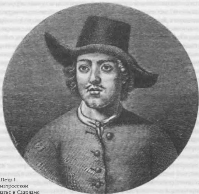
1. Петр I в матросском платье в Саардаме

Эндрю Фергансона переехать в Россию. С особым восторгом Петр и сопровождавшие его лица восприняли подписание торгового договора, по которому адмиралу лорду Кармартену была продана монополия на торговлю в России табаком. В Англии Петр вновь работал на верфи, осматривал военные корабли, наблюдал показательные морские маневры, специально для него организованные английским правительством, учился собирать часы, изучал артиллерийское производство и другие полезные вещи. Досуг царя и его спутников был примерно таким же, как и на родине: после их отъезда владелец дома, арендованного для них английским правительством, предъявил счет за изломанную мебель, испорченные картины, ковры и даже окружавший дом парк.