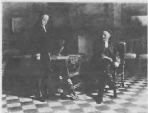
4. Петр I допрашивает царевича Алексея в Петергофе С картины Н. Н. Ге.