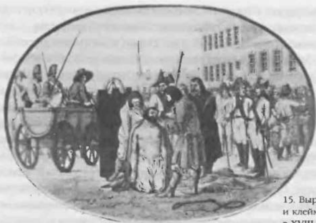
15. Вырезание ноздрей и клеймение преступников в XVIII в.

человека виновным, и только с момента приговора его можно считать преступником. Во время следствия недопустима пытка, нет нужды и в смертной казни. Такого наказания заслуживают лишь преступники, угрожающие самим основам существования государства, его спокойствию и благополучию. Государство же, живущее в условиях внутренней и внешней стабильности, может защитить себя, и не лишая своих граждан жизни*.