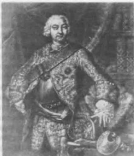
11. Граф Петр Иванович Шувалов

веселая. По-видимому, супруги очень подходили друг другу, ибо и Петр Шувалов был человеком умным, способным и одновременно тщеславным, жадным и неразборчивым в выборе средств для достижения своих целей. Уже к середине 40-х годов он имел генеральские чины, графский титул и ранг камергера, а к концу десятилетия практически полностью захватил дела внутреннего управления в свои руки. Современники единодушно осуждали его нравственные качества, которые к тому же создавали при дворе