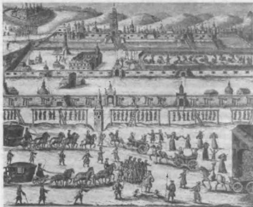
2. Казнь стрельцов в Москве в 1698 г.

возвращения царя в Москву 122 участника бунта были казнены и около 2 тысяч в цепях развезли по острогам. Петр велел привезти стрельцов назад и возобновить следствие. В течение всего сентября доставленных в Преображенское стрельцов пытали и избивали, добиваясь от них признаний в умысле на жизнь царя, членов его семьи, бояр и иноземцев, а также об участии в заговоре царевны Софьи. Петр лично принимал участие в пытках и собственноручно отрубил головы пятерым стрельцам. Царь не поленился и съездить в Новодевичий монастырь, чтобы самому допросить старшую сестру. Софья ни в чем не сознавалась, и ее пытать все же не стали. В пытках и казнях Петр заставлял принимать участие и своих ближайших соратников: своим усердием в отрубании голов они должны были доказать свою преданность царю. Одновременно, наподобие членов бандитской шайки, все эти люди оказывались как бы повязаны кровью своих жертв, и теперь им не оставалось ничего другого, как идти с Петром до конца.