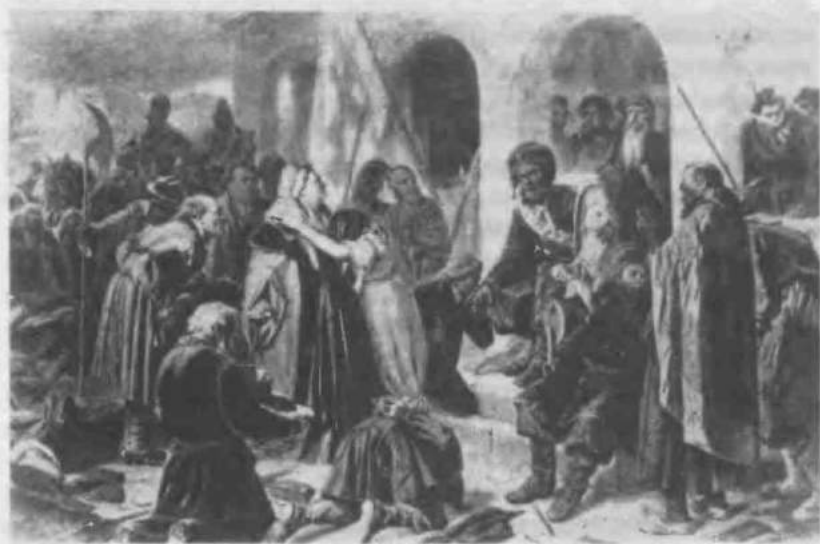
16. Пугачев. С картины В. Перова

и главными действующими лицами восстания были казаки. Их основной целью было уничтожить дворянство, с тем чтобы занять его место в государстве. В истории русского казачества это была последняя попытка подобного рода. Наряду с казаками в восстании приняли участие и другие группы населения, каждая из которых преследовала собственные цели. В первую очередь это, конечно, крестьяне, боровшиеся против крепостного ига, затем представители нерусских народов Поволжья, борьба которых носила национально-освободительный характер, и, наконец, часть заводских рабочих Урала, чьи чаяния практически не отличались от крестьянских. Участниками восстания были и сосланные на Урал поляки. При столь разноплановых целях можно не сомневаться, что в случае победы восставших конфликт в их собственном лагере был бы неминуем. Провозгласив себя чудом спасшимся от руки убийц императором Петром III, донской казак Емельян Пугачев подписывал указы, составленные на манер царских, жаловал своих приближенных дворянскими титулами и создавал органы управления, подобные существовавшим в России того времени. Для привлечения на свою сторону масс крестьянства