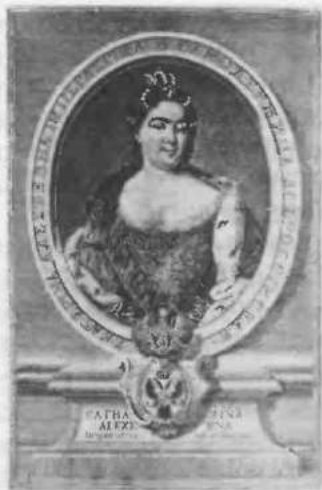
б. Императрица Екатерина I

свету демократической интеллигенции конца XIX века, к которой он сам принадлежал, но доля истины в его словах все же есть, хотя описанное им не было чем-то специфически русским. Другое дело, что резкий обрыв старой традиции и слишком поспешное усвоение идеи женского равноправия не могло не привести к определенным издержкам. Но вернемся к первой женщине на русском троне — Екатерине I.