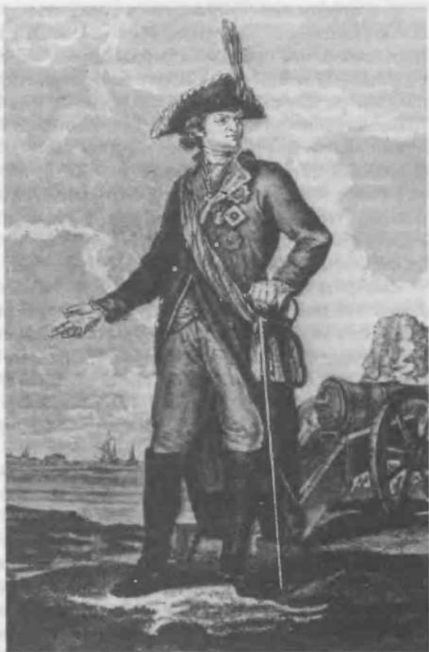
19. Князь Г. А. Потемкин- Таврический

ние Турции, а главным его организатором стал Г.А. Потемкин. Именно с путешествием Екатерины II в Крым связано известное выражение «потемкинские деревни». Считается, что Потемкин якобы построил вдоль дороги грандиозные декорации, изображавшие несуществующие селения. На самом деле сами по себе декорации были обычными для любых придворных празднеств того времени, и Потемкин декорировал реальные селения, но сделал это настолько пышно, что зрители стали сомневаться в подлинности даже того, что существовало на самом деле.