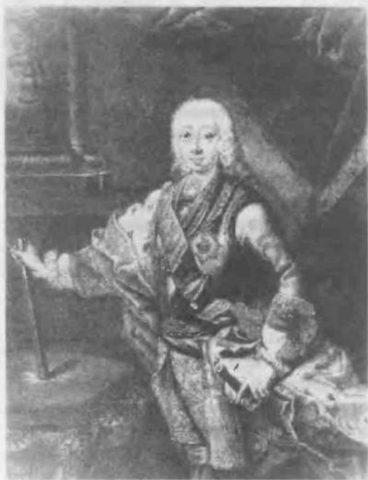
12. Император Петр III

Между тем сам Петр, казалось, ничего не понимал и не замечал. Как вырвавшийся из-под присмотра взрослых ребенок, он бурно радовался возможности делать, что ему вздумается, и жить, как ему нравится. Он по-прежнему эпатировал публику во время церковных церемоний, устраивал бесконечные вахт-парады, шумные пирушки с друзьями по вечерам и всюду появлялся в обществе своей любовницы Елизаветы Воронцовой. И тем не менее за шесть месяцев пребывания на троне он успел осуществить несколько важных внутривластных преобразований и изменений во внешней политике страны. В феврале 1762 года император подписал сразу три важнейших указа — о ликвидации Тайной канцелярии, о вольности дворянства и о секуляризации церковных земель.