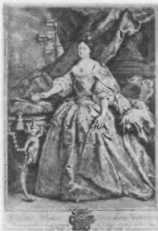
7. Императрица Анна Иоанновна

человека, складываются не только из значительных, но и из множества мелких событий.