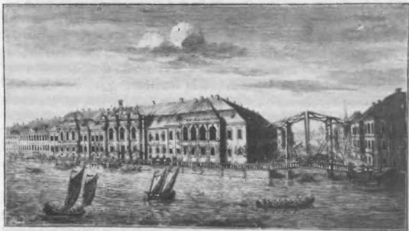
9. Зимний дворец первой половины XVIII в.