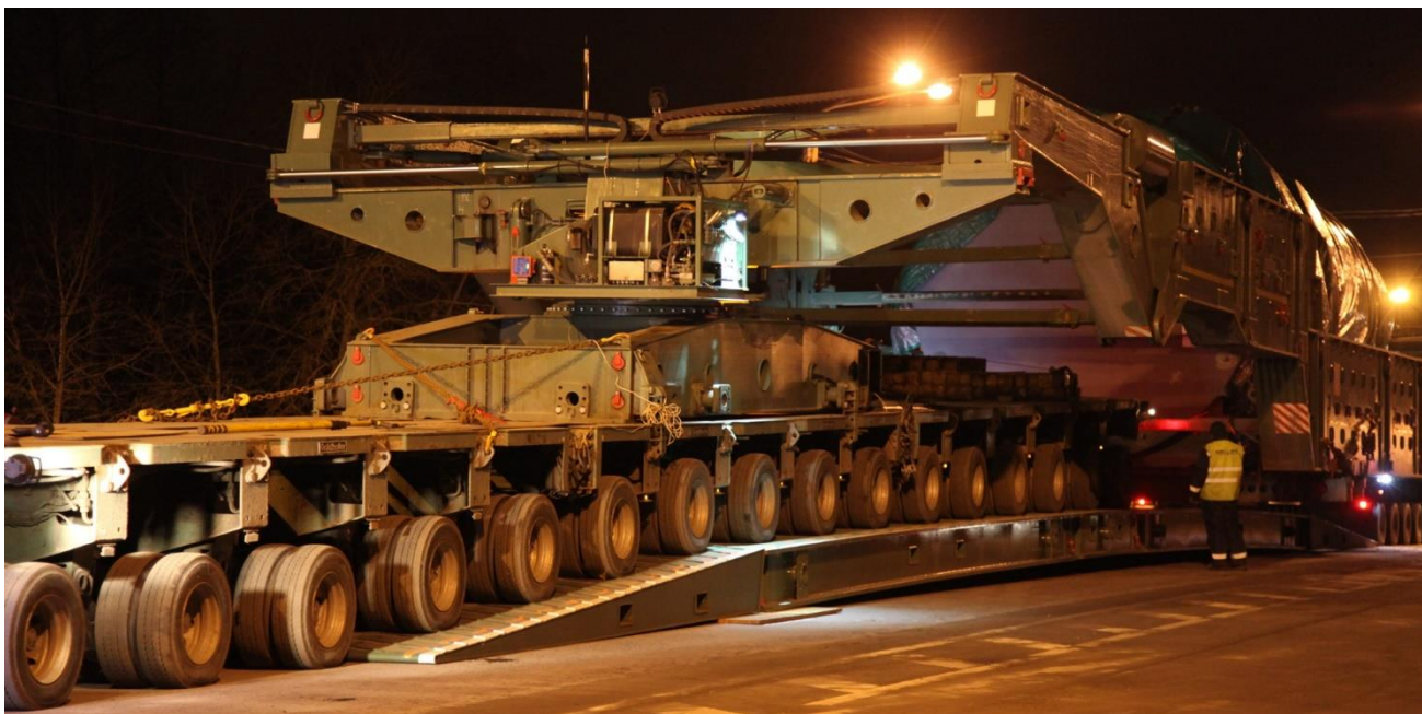
Рис. 2. Проезд модульного транспортера по мобильному мосту

Мобильный мост – легкоразборное устройство для переезда тяжеловесных транспортных средств через мостовые сооружения с несущей способностью меньше требуемой (рис. 2, 3). Мобильный мост состоит из двух параллельных пролетных строений.