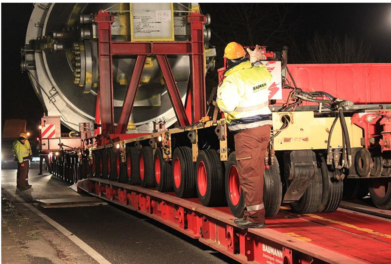
Рис. 3. Проезд модульного транспортера по мобильному мосту