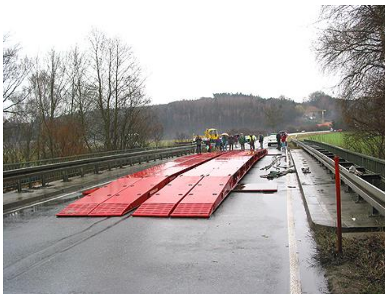
Рис. 1. Мобильный мост

В некоторых случаях даже значительное увеличение числа осей в модульном транспортере неудовлетворительно распределяет нагрузку от веса груза по дорожному полотну. В числе таких случаев: перевозка груза через мост, несущая способность которого крайне ограничена. Проезд модульного транспортера с грузом по такому мосту может стать причиной его обрушения. Таким образом, провозка груза по данному участку пути затруднительна. Решением проблемы может стать строительство вблизи существующего моста параллельного второго временного моста с требуемыми характеристиками, либо установка (на время проезда модульного транспортера) поверх существующего сооружения мобильного моста (рис. 1).