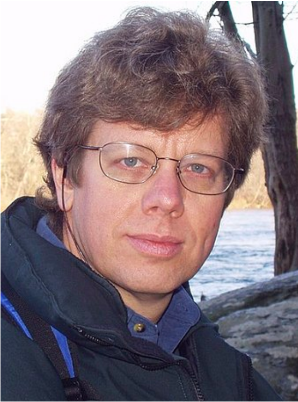
Guido van Rossum, der Entwickler von Python

Dezember 1989 ist Pythons Geburtstag. G. v Rossum ist der Hauptautor vom Python, und spielt die Hauptrolle bei der Entscheidung der Entwicklungsrichtung.