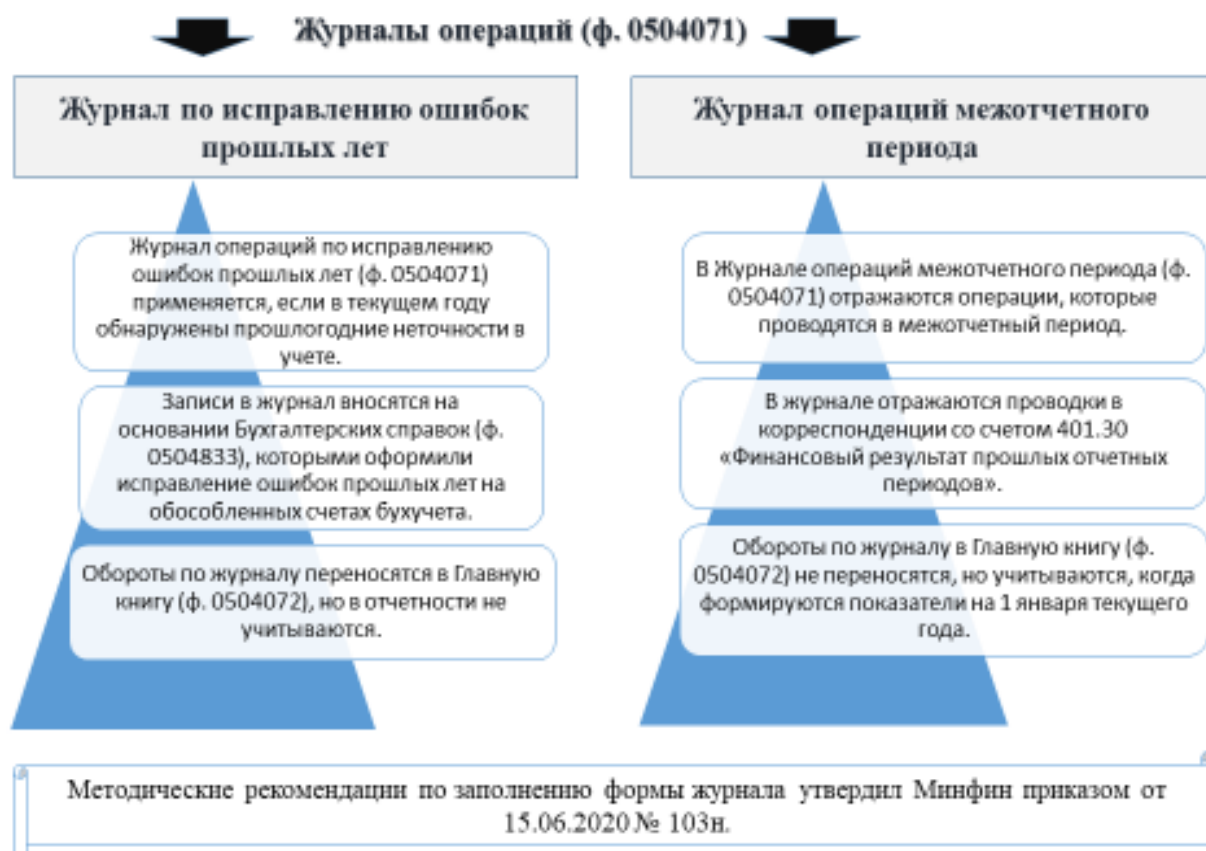
Рисунок 2 - Алгоритм работы с журналами для операций межотчетного периода и операций по исправлению ошибок с 27 сентября 2020 года

подписей (далее-ЭЦП), что удобно, так как позволяет не изготавливать квалифицированные электронные подписи для всех подписантов учреждения.