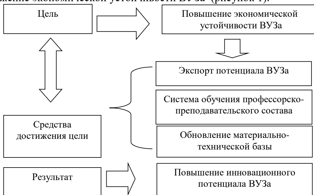
Рисунок 1 – Блок – схема достижения экономической устойчивости ВУЗа

Для решения всех обозначенных задач, ВУЗ должен быть экономически устойчивым. Нами предлагаются основные направления, направленные на достижение экономической устойчивости ВУЗа (рисунок 1).